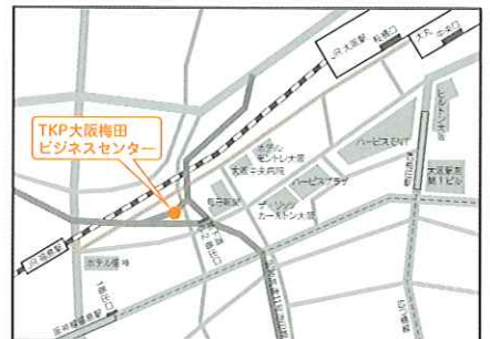
JR「大阪駅」・阪急「梅田駅」・阪神「梅田駅」・地下鉄四つ橋線「西梅田駅」の地下街を通り、6-2番出口を出てすぐ。 JR「福島駅」徒歩2分、阪神「福島駅」徒歩5分、JR東西線「新福島駅」徒歩5分。

開催日時：平成22年10月30日(土) 10:00～16:30(受付開始9:30より) 会場：TKP大阪梅田ビジネスセンター 16F (大阪市福島区福島5-4-21) 定員：100名 対象：地域において子育て支援活動を展開しているNPOの活動者・ボランティアスタッフや保育士、学生など子どもや子育て支援に関心のある方 参加費：無料 一時保育：無料(定員20名) ※要事前申し込み 主催：財団法人こども未来財団・NPO法人関西こども文化協会 後援：文部科学省、社会福祉法人全国社会福祉協議会、大阪府、大阪市、堺市、社会福祉法人大阪府社会福祉協議会、社会福祉法人大阪市社会福祉協議会、社会福祉法人堺市社会福祉協議会、大阪府教育委員会、大阪市教育委員会、堺市教育委員会