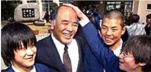
03年3月朝日新聞ヒューマンメモリーより